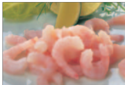
Scampi Naturell, 100/200 lbs.

5 x 1 kg Pr. krt. 5,0 kg Findus 20856 EPD.vnr.: 1 030 626