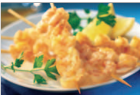
Scampi Brochette, 60 g

50 x 60 g Pr. krt. 3,0 kg Findus 83496 EPD.vnr.: 1 105 220