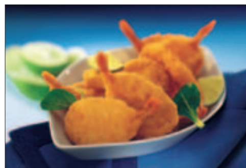
Scampi Butterfly, 25 g

200 x 25 g Pr. krt. 5,0 kg Findus 73458 EPD.vnr.: 1 107 655