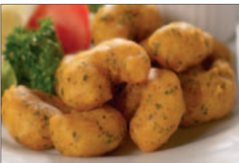
Scampi Fritti Provençale

5 x 1 kg Pr. krt. 5,0 kg Findus 462706 EPD.vnr.: 1 030 410