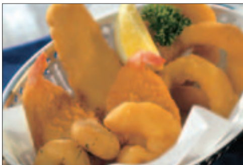
Fisherman's Platter, 200 g pose

20 x 200 g Pr. krt. 4,0 kg Findus 4645 EPD.vnr.: 552 075