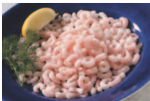
Reker, pillede singelfryst

2 x 2 kg Pr. krt. 4,0 kg Findus 469329 EPD.vnr.: 422 964