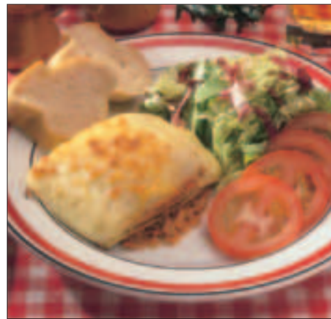
Lasagne i porsjon, 160 g

Kokt ris 41%, kyllingfilet 8,5%, stekt løk (løk, vegetabilsk olje), krydderpølse 7% [oksekjøtt, oksefett, vann, stivelse, røkaroma, salt, krydder, sukker, hvitløkspulver, oregano, fargestoff (E120)], stangselleri, rød paprika, delvis herdet vegetabilsk olje, tomatpuré, purre, kokt villris, salt, gjærekstrakt, druesukker, løkpulver, krydder, tomatpulver, sukker, hvitløk, vineddik, fargestoff (sukkerkulør, betkaroten), urtekrydder, aroma, grønnsakekstrakt (gulrot, purre, persille), krydderekstrakt, oksekjøttekstrakt og stabilisator (E500, E331). 17% grønnsaker.