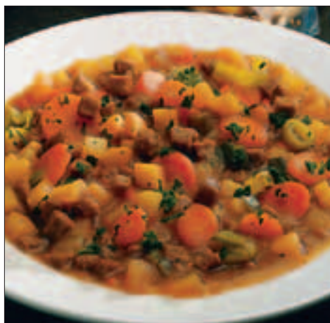
Lapskaus - *gir 12 kg ferdig lapskaus

Makaroni, erter, paprika, mais, løk, vann, karbonadekjøtt 10% (storfekjøtt, skummet melk, potet, løk, potetmel, potetflak, salt og krydder), champignon, tomat, tomatpuré, potet- terninger, potetmel, skummetmelkpulver, potetflakes, salt, tørket løk, krydder og hvitløkpulver.