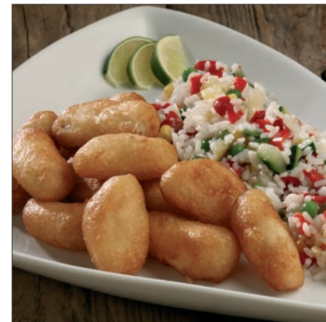
Steinbit Fritti - 90350

5 kg (5 x 1 kg) Antall: ca 334 x 15 g. Anbefalt porsjonsstørrelse: Porsjoneres etter behov