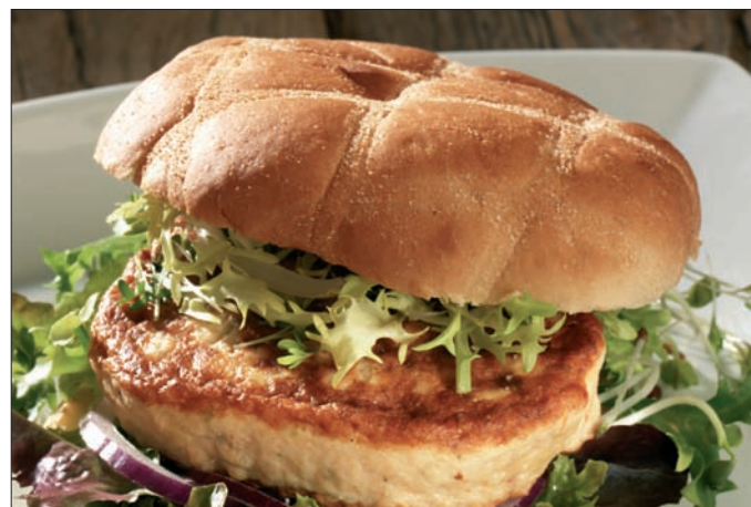
Lakseburger - 19514

Vekt 4,8 kg (2 x 2,4 kg) Antall porsjonsstørrelse: Ca 40 x 120 g. Anbefalt porsjonsstørrelse: 1 stk. à 120 g. Gir ca. 40 porsjoner pr. krt.