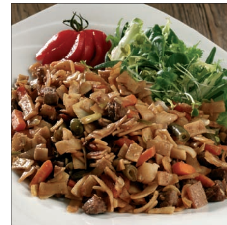
Bami Goreng - 5584

Gluten - Melkeprotein - Egg - Soyaprotein -