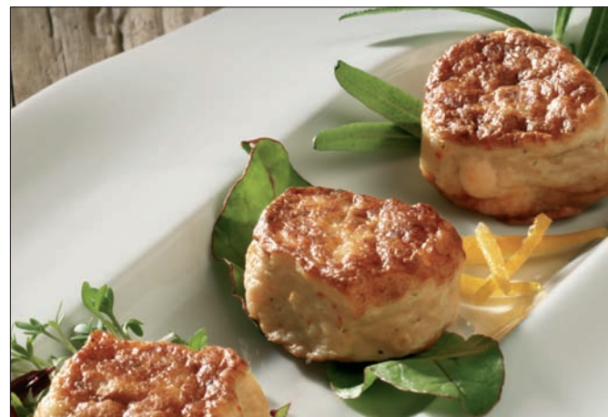
LakseGrillers - 90324

Gluten Ja Melkeprotein Ja Egg - Soyaprotein -