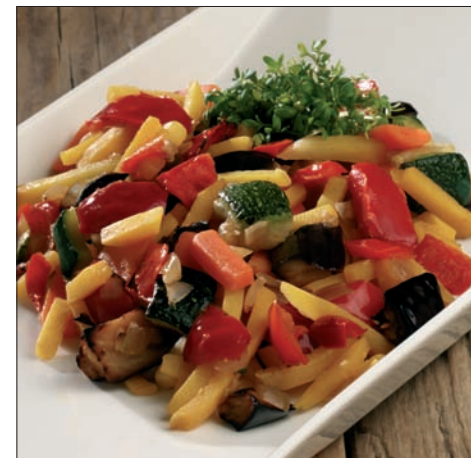
Spanske Grillgrønnsaker - 84234

Gluten Ja Melkeprotein Ja Egg - Soyaprotein -