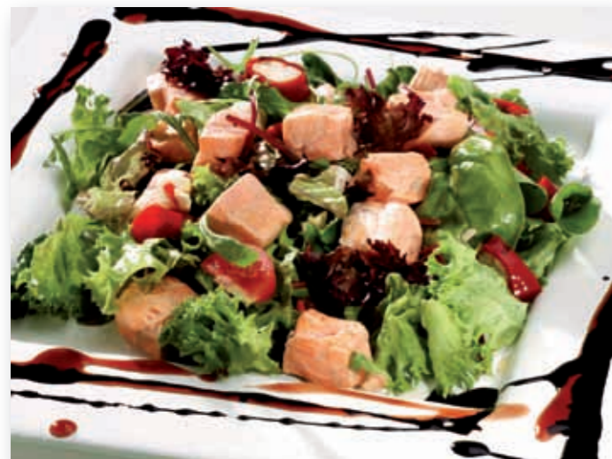
Laksekuber, 14 g - 88510

Laksekuber er som skapt for tilsetning til supper, gryter, pastaretter, fiske- retter og salater. Laks er sunn tilsetning til de aller fleste retter. Våre nye kuber er renskårne og like store biter av laks. Størrelsen er perfekt og fremstår delikat på anretningen. Tilberedes rett fra dypfryst tilstand. Laks er godt for matgleden, godt for hjertet. Bruksmulighetene er nesten uten grenser, her kan du la din fagkunnskap og fantasi gå hvilke veier du vil. Sunn mat på små eller store fat - laks er sunt året rundt. Laksen dampes, stekes, trekkes eller wokes til en god garnityr.