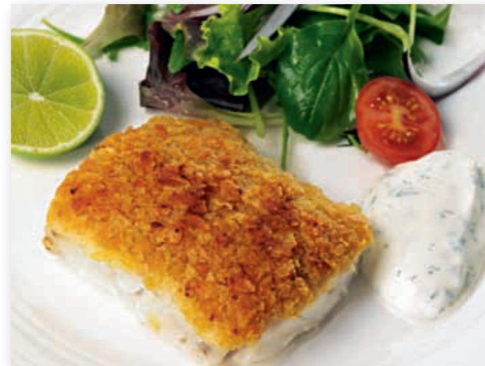
Fisk Benedictine med økologisk topping, 160 g - 90303

Fisk Benedictine er en smakfull og sunn tilvekst til fisk i topping-familien. Her er en ny, frisk smak i kombinasjon med saftig, god fisk. Toppingen, som blant annet består av ost, potetcrisp og krydder, ligger rolig på fisken hele veien fram til tallerkenen, og bidrar også til å holde fisken varm lenger. Denne varianten har en økologisk topping som er garnert på MSC-godkjent Alaska Pollock. Det betyr at fisken kommer fra et fiskeri som er sertifisert etter Marine Stewardship Councils miljøkrav for et veldrevet og bærekraftig fiske.