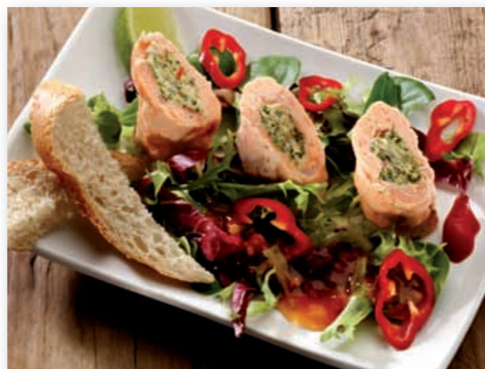
Lakserullade med broccolicrème, 140 g - 92008

Her kommer en fin oppfølger i Fish Roll familien - en laksevariant som fremstår med nye farger og nye smaker på lunsj- eller middagstallerkenen. Laksen er fylt med en balansert stuing med blant annet ost, broccoli og paprika. Dette produktet kan også kjøles ned etter varmebehandling og tåler kreative tilberedninger til dekorative forretter og kanapeer. Perfekt også som tapasfat eller laksefat på buffeten, mulighetene er mange. Lakserulladene matcher det aller meste av fantasifullt garnityr.