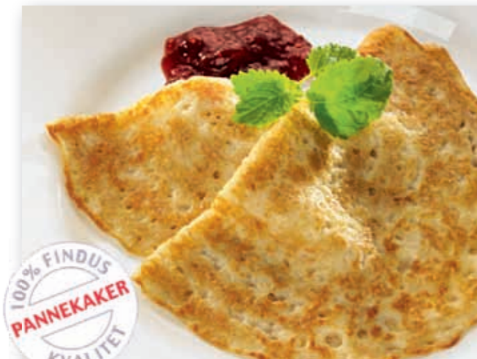
Pannekaker, økologiske - foldet én gang, 60 g - 83194

En klassiker kommer nå også som økologisk. Vi i Findus er opptatt av å verne om miljø og fremtid. Med denne nyheten gjør vi det lett for deg å servere økologiske pannekaker. Våre nye pannekaker er merket med EU's felles logo for økologiske produkter. Logoen er en garanti for at minst 95% av varens ingredienser som har sitt utspring fra jordbruk, er økologisk og at produktet stemmer overens med det offentlige inspeksjonssystemets regelverk. Pannekaker er godt til frokost, mellommåltid, middag eller dessert - du bestemmer når, hvordan og med hva.