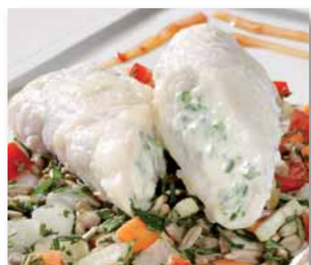
Koljerullade m/hvitløkscrème, 140 g 63190