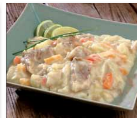
Klippfiskgryte Senja 88770 (Torsk)

10 kg (4 x 2,5 kg) Pakket i kokeposer EPD 1 415 231