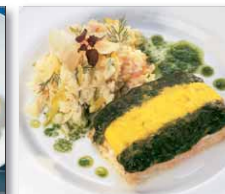
Laks m/spinat og hollandaise, 160 g 4541