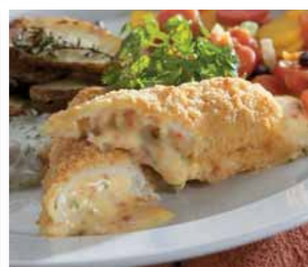
Sprb. Fiskerullade Cheddar, 160 g 147317 (Alaska Pollock)