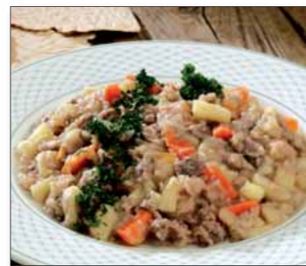
Lapskaus m/salt kjøtt, lys 88643 (Storfe)

10 kg (4 x 2,5 kg) Pakket i kokeposer EPD 1 415 173