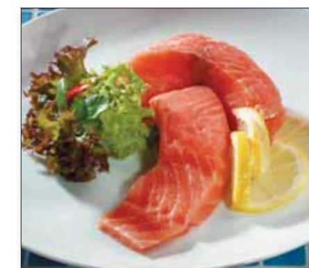
Kokelaks i stk. u/skinn og ben, 75 g 272385

Den fete laksen er rik på Omega-3 fett- syrer - det såkalt gode fett. Forskning har vist at Omega-3 har positiv virkning på mange forskjellige sykdommer i tillegg til hjerte- og karsykdommer, så vi kan trygt konstatere at laks er sunt året rundt!