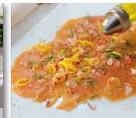
Laksefilet, rokt/skiveskåret 1,0 - 1,5 kg pr. stk. 272 351