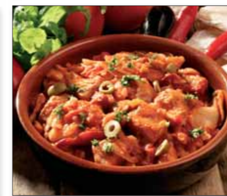
Bacalao Lofoten 83421 (Torsk)

10 kg (4 x 2,5 kg) Pakket i kokeposer EPD 1 278 712