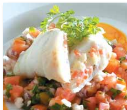
Fiskerullade Julienne, 145 g 83811 (Alaska Pollock)

Etter en enkel tilberedning er det bare å bruke fantasien. Her er mulige forretter, snacks, garnityr, her er det du måtte ønske å servere til mange forskjellige anledninger. Fish Rolls er en fryd for øyet og en glede for ganen.