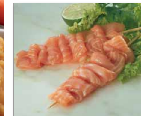
Laksebrochette, 60 g 83847