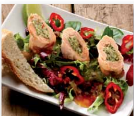
Lakserullade m/broccolicrème, 140 g 92008