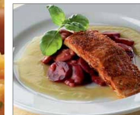
Urte-/hvitløksmør, 1,0-1,5 kg pr. filet 8777