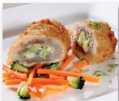
Sprb. Fiskerullade m/broccolicrème, 80 g 97928 (Sei)

Nyheter! Findus lanserer 6 nyheter - fra gourmetskåren fiskefilet til kålrotstappe