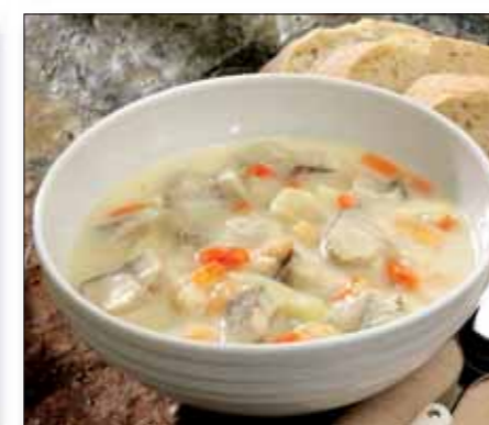
Fiskesuppe m/scampi 88580 (Sei)

10 kg (4 x 2,5 kg) Pakket i kokeposer EPD 1 415 132