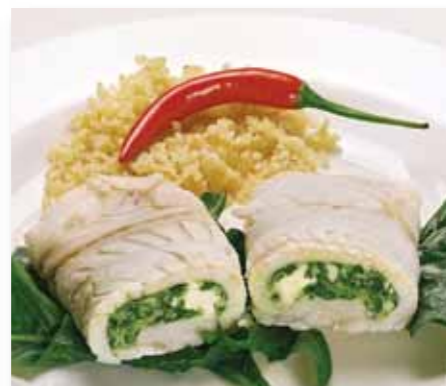
Fiskerullade Kreta, 150 g 50727 (Alaska Pollock)