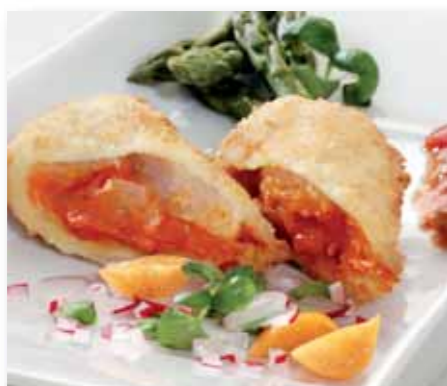
Sprb. Fiskerullade Mexicali, 80 g 87492 (Alaska Pollock)