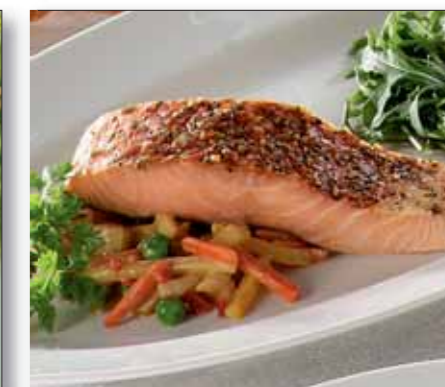
Laksefilet, krydderbakt, 1,0 - 1,5 kg pr. filet 8776