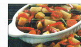
Sautégrønnsaker m/sparg & mango

4 x 1,5 kg Pr. krt. 6,0 kg. - Findus 7108 EPD.vnr.: 733 923